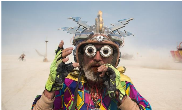
Deelnemers aan het Burning Man Festival: hun leven door de lens; for the joy of life .