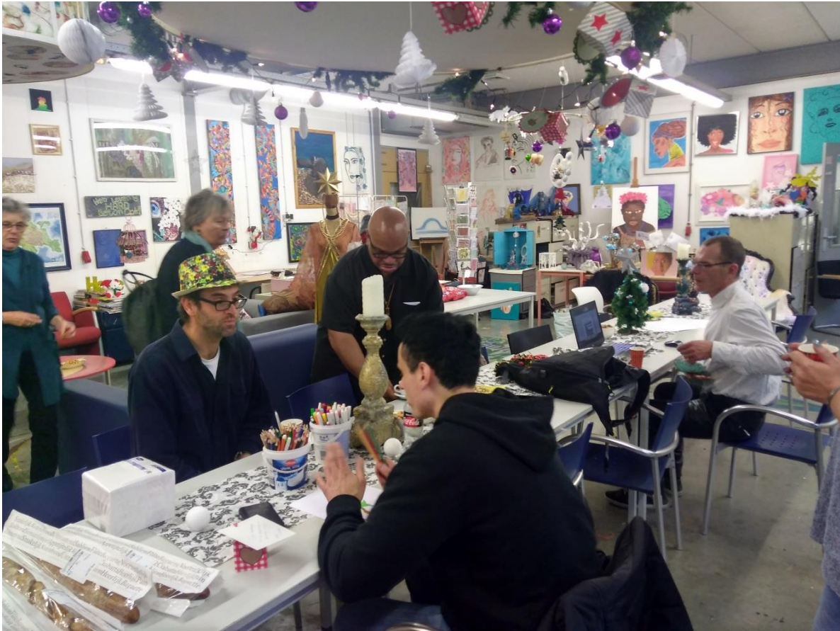
Inside the Living Museum in Bennebroek